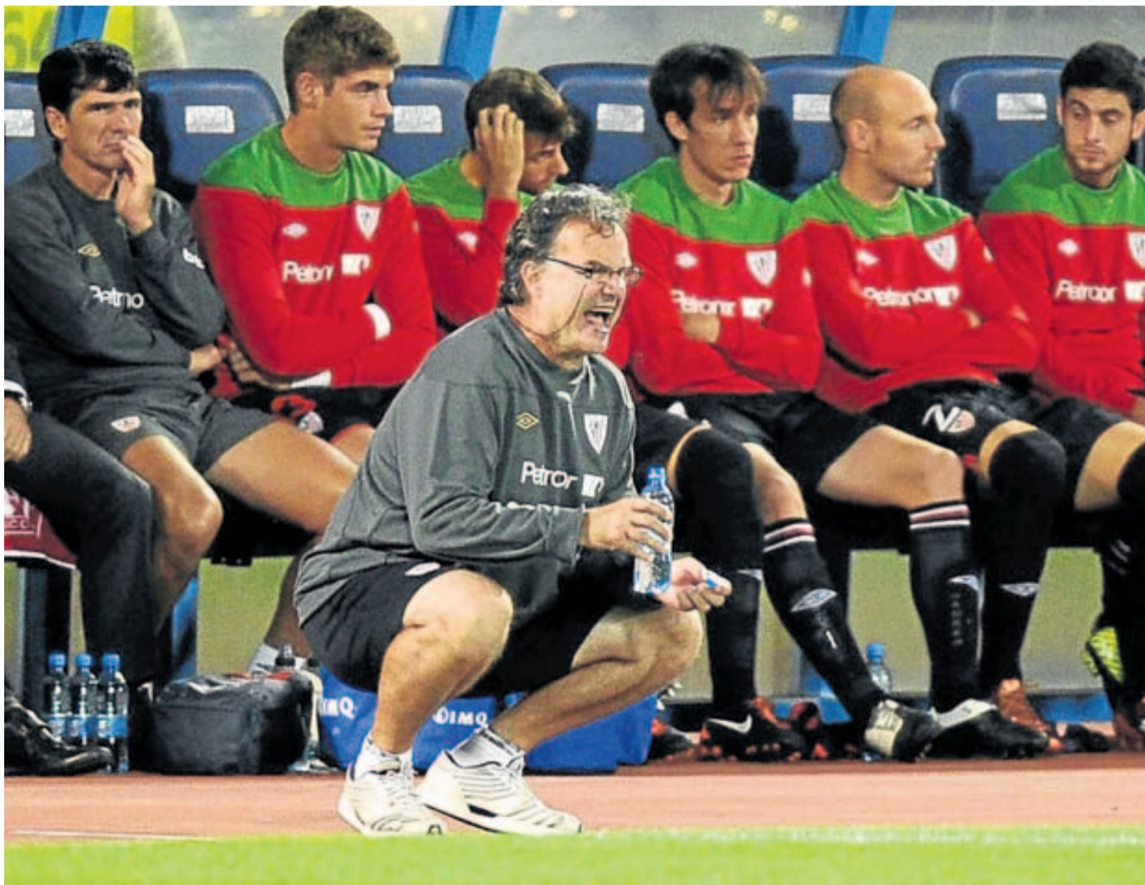
Marcelo Bielsa estuvo muy activo durante todo el partido y no paró de dar instrucciones a sus hombres.

Lo peor: El desperdicio de goles cantados.