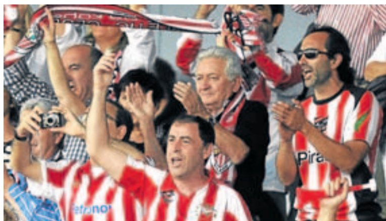
Unos 200 hinchas del Athletic estuvieron en el estadio Pasienny.

Por otro lado, la Peña Athletic Gamiz-Fika celebrará el 17 de marzo de 2012 la decimotercera edición de su hermanamiento de peñas, fin de semana que coincide con la visita del Valencia a San Mamés.