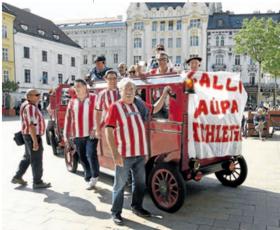
Los aficionados del Athletic se dejaron notar en las calles de Bratislava.

Segundo y último recambio de un equipo que sumó con merecimiento los primeros tres puntos en su nueva e ilusionante aventura europea.