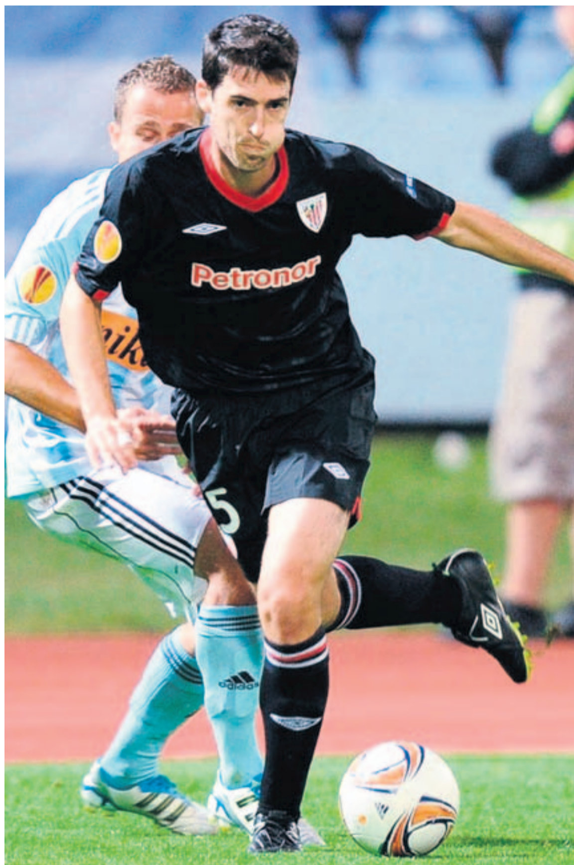
Andoni Iraola firmó su primer partido oficial como titular de la temporada.