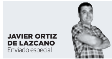
JAVIER ORTIZ DE LAZCANO Enviado especial