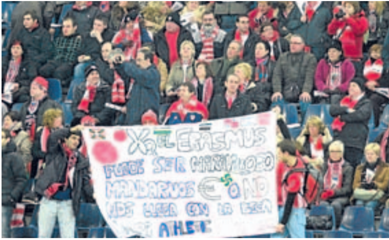
Hubo mucho colorido rojiblanco en el campo del Salzburgo.

trada a Toquero y justificó la salida del navarro por la «imposibilidad de filtrar pases finales y dar peligro» al ataque del Athletic.