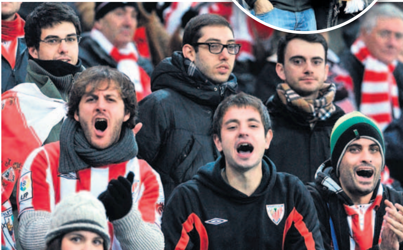
Unos 700 aficionados del Athletic animaron al equipo desde las gradas del Red Bull Arena.

La buena racha del Athletic continúa sin romperse y anoche, en Salzburgo, los hombres de Bielsa se adelantaron en el marcador gracias a un gol de Ander Herrera y luego supieron conservar la ventaja. «Nunca renunciamos a jugar», manifestó el entrenador de Rosario nada más acabar el partido, que calificó de «equilibrado y disputado». Valoró la entrega de sus futbolistas, aunque asumió que debía haber retrasado la sustitución de Muniain, realizada en el descanso. «Podía haberla demorado porque el segundo tiempo se asemejó mucho al escenario donde él fructifica», explicó el argentino, quien dio en-