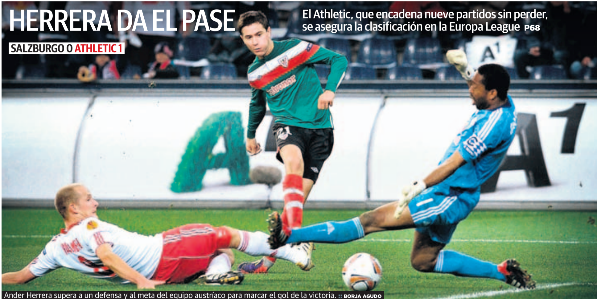
Ander Herrera supera a un defensa y al meta del equipo austríaco para marcar el gol de la victoria.