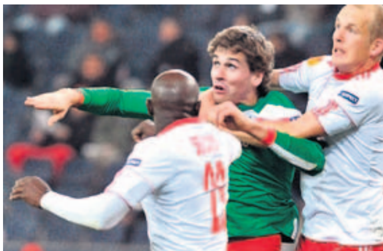
LLorente no dio descanso a la defensa austriaca.

tido a ese terreno que le convenía y crearon dos buenas ocasiones en la portería de Iraizoz, una de Cziommer en un disparo desde fuera del área y otra de Jantscher en una bella jugada colectiva de los chicos de Red Bull. El Athletic, por su parte, tenía la posesión y buscaba la forma de hacerla fructífera. Le costaba conseguirlo ante una defensa, la del Salzburgo, con bastante oficio y cierta propensión a